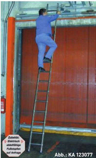
Abb.: KA 123077