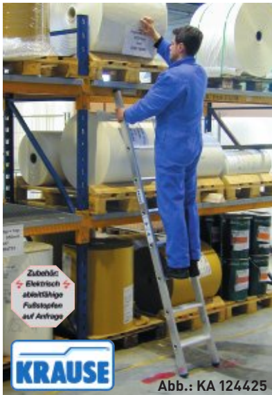
Abb.: KA 124425