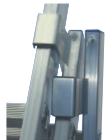
Alu-Beschlagteile mit Kunststoffeinlage