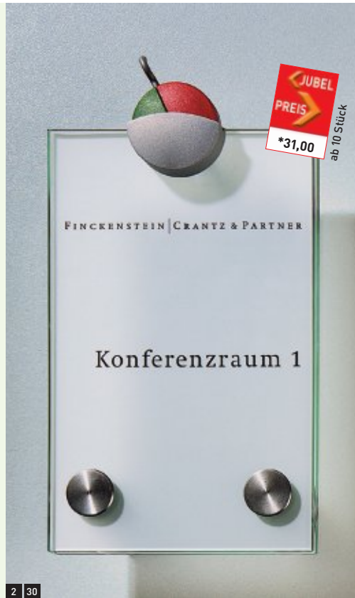
2 30 Türschild, 100 x 160 mm, mit Frei-/Besetzt-Anzeige