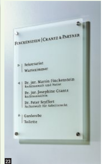
23 Wegweiser, 400 x 600 mm