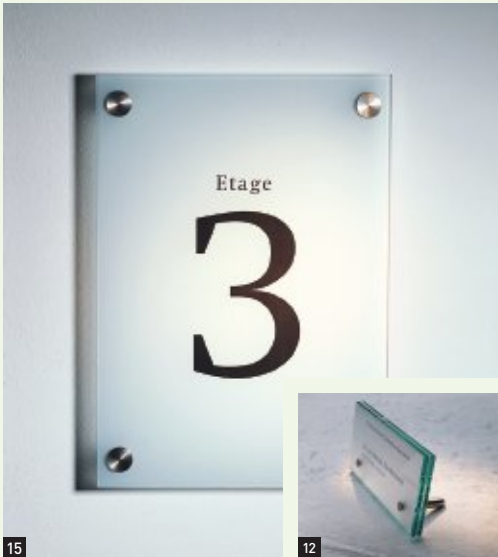
15 Wandschild A4 12 Tischaufsteller, 150 x 70 mm