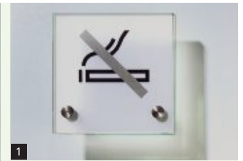
1 Türschild, 100 x 100 mm