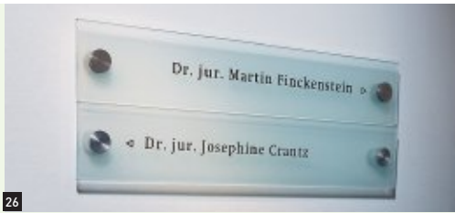
26 Infoleiste Wand, 700 x 120 mm