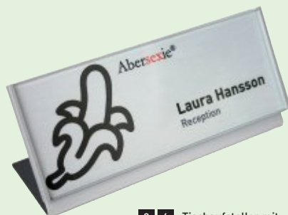
2 6 Tischaufsteller mit Türschild 150 x 60 mm