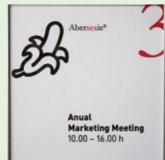
4 Türschild 150 x 150 mm