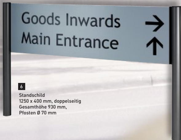
6 Standschild 1250 x 400 mm, doppelseitig Gesamthöhe 930 mm, Pfosten Ø 70 mm

Robustes Metallständerwerk, feuerverzinkt, ausgelegt für höchste Windlasten, Kommunikationsflächen aus Alu (diebstahlsicher mit dem Ständerwerk verbunden), Standfüße mittelgrau pulverlackiert.