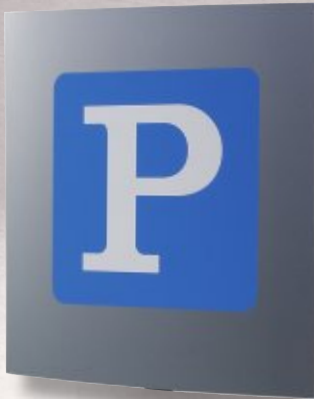
8 Wandschild, 300 x 300 mm

Wählen Sie nach Ihrem Geschmack unter 2 Formen (flache oder leicht gewölbte Oberfläche) und 8 aktuellen Farben frei aus.