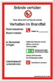
Brandschutzordnung BRD und Landkreis München DIN 14096-1 Teil A