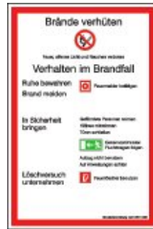
Brandschutzordnung Stadt München DIN 14096